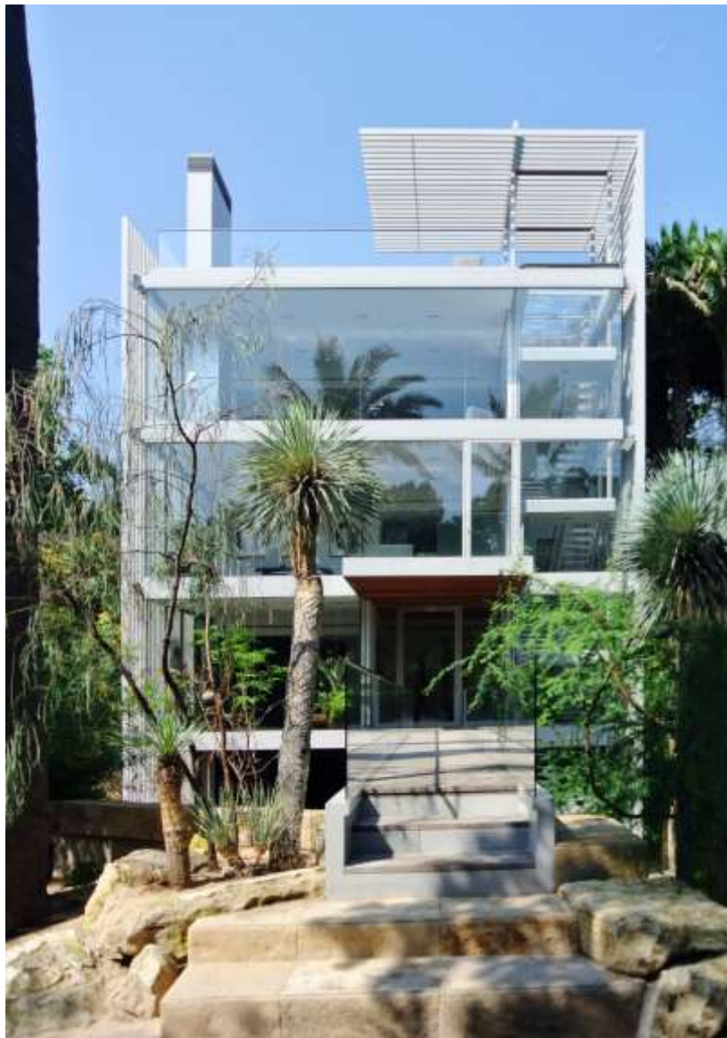
عکس: خوان میرو

اطلاعات بیشتر در مورد ساختمان انجمن فیزیک امریکا را در اینجا مطالعه کنید.