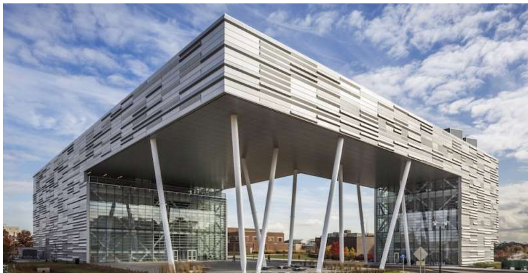
دانشکده‌ی کسب‌وکار دانشگاه روتگرز جایزه‌ی ملی پروژه‌های بین ۱۵ تا ۷۵ میلیون دلار را در مراسم IDEAS 2016 برنده شد.

مراسم اهدای جوایز IDEAS که هر ساله توسط انجمن سازه‌های فولادی آمریکا (AISC) برگزار می‌شود، پروژه‌های فولادی منحصر به فرد ایالات متحده آمریکا را شناسایی و معرفی می‌کند. این جایزه بالاترین افتخار را برای پروژه‌های ساختمانی صنعت سازه‌های فولادی در ایالات متحده به ارمغان خواهد برد.