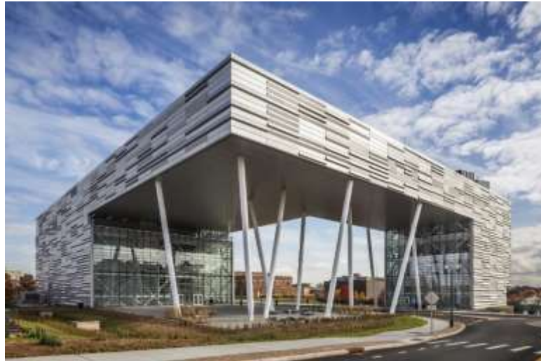
عکس: TEN Arquitectos

جایزه‌ی ملی: دانشکده‌ی کسب‌وکار دانشگاه روتگرز، نیوجرسی، پیسکتاوا