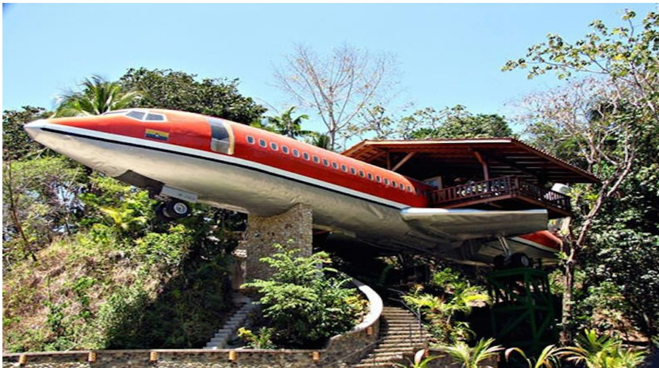
۹- خانه Flinstones

اخیراً این خانه های یک خوابه و دو خوابه به مبلغ باور نکردنی ۱.۸ میلیارد به فروش رسیدند. معمار این خانه ها فیلیپ جان بران (Phillip Jon Brown) توضیح داد که سازمان حفاظت از کوه سانتا مونیکا (Santa Monica Mountains) تمایلی نداشت تا این خانه ها در آن منطقه حفاظت شده ساخته شود اما طراحی این خانه ها به صورت سنگی مورد موافقت قرار گرفت.