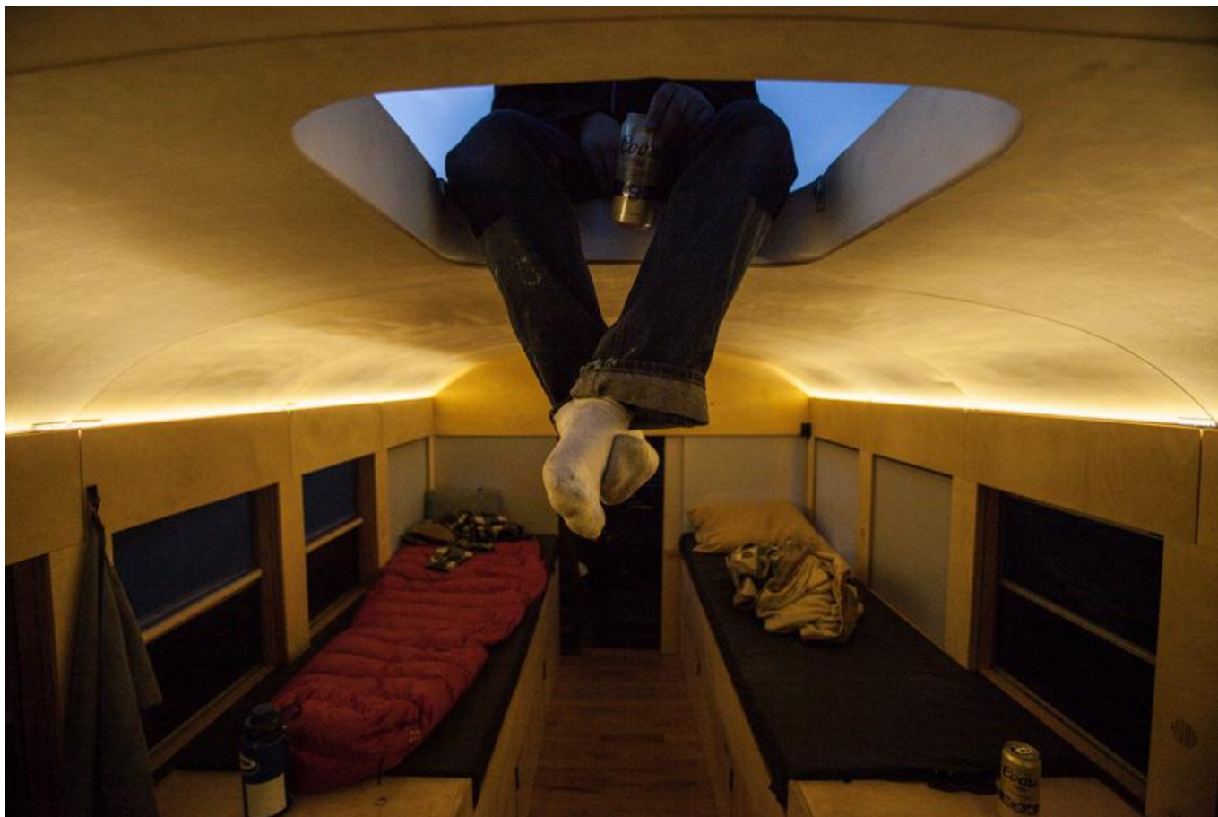
۲- خانه کانکسی قابل حمل

خریداری کرد و با تغییر کاربری آن ها دست به این اقدام زد. نتیجه نهایی فعالیت این دو برادر یک خانه چند منظوره بسیار بزرگ است که می تواند جاده های بی انتهای بزرگی را پشت سر بگذارد.