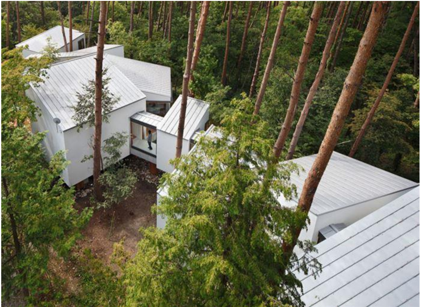
۸- هتل بوئینگ ۷۲۷ در کاستاریکا

این خانه در ژاپن واقع شده است. این خانه ها در دل جنگل ها ساخته شده اند و بالاترین سطح سازگاری با محیط زیست را دارند. این خانه های محصور شده به یک دیگر متصل هستند و این به معنای این است که به جای تقابل در برابر جنگل همراه با آن عمل می کنند. معمار این طرح کیسوکه کاواگوچی (Keisuke Kawaguchi) این خانه ها را به گونه ای طراحی کرده است که در فضای خالی بین درختان ساخته شوند تا از قطع درختان و یا تجاوز به حریم زیستگاه طبیعی جلوگیری شود.