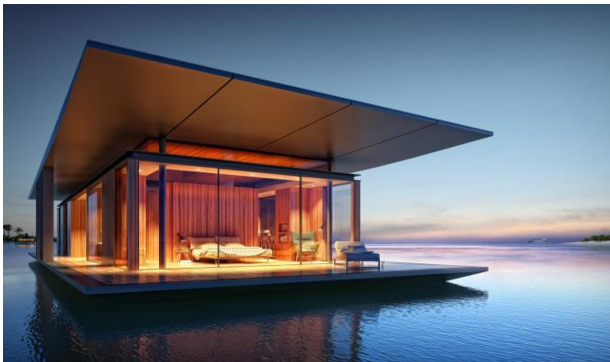
۶- خانه شیشه ای

مطمئناً همه ما می دانیم که چرا نباید هرگز به خانه های شیشه ای سنگی پرتاب کنیم اما می توانیم بعضی از آن ها را نگاه کنیم و به تحسین آن ها بپردازیم. یک زوج در ایالت ویرجینیای غربی تصمیم گرفتند تا در خانه ای که در یک حراجی خریده بودند تغییراتی در پنجره ها اعمال کنند. نتیجه نهایی فعالیت این زوج خیره کننده است، چشم اندازی زیبا از غرب ویرجینیا به عنوان حیاط خلوت.