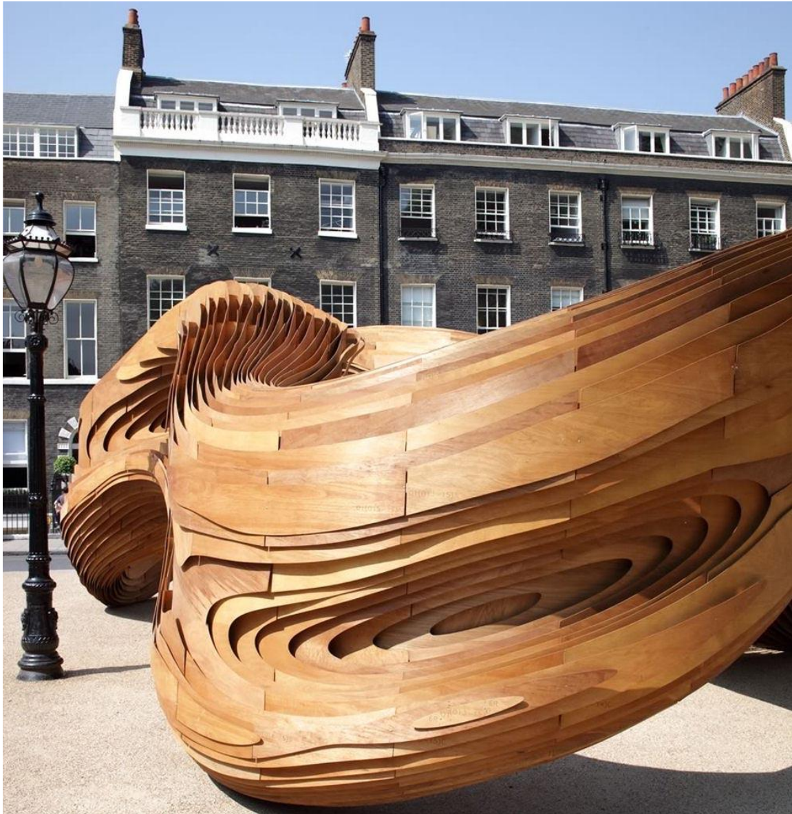
پایون (غرفه) تابستان ۲۰۰۹ - موسسه معماری AA

در جستجوی برترین‌ها در زمینه نوآوری و موضوعات و برنامه‌های درسی نوین، به دانشگاه‌های زیر رسیدیم: