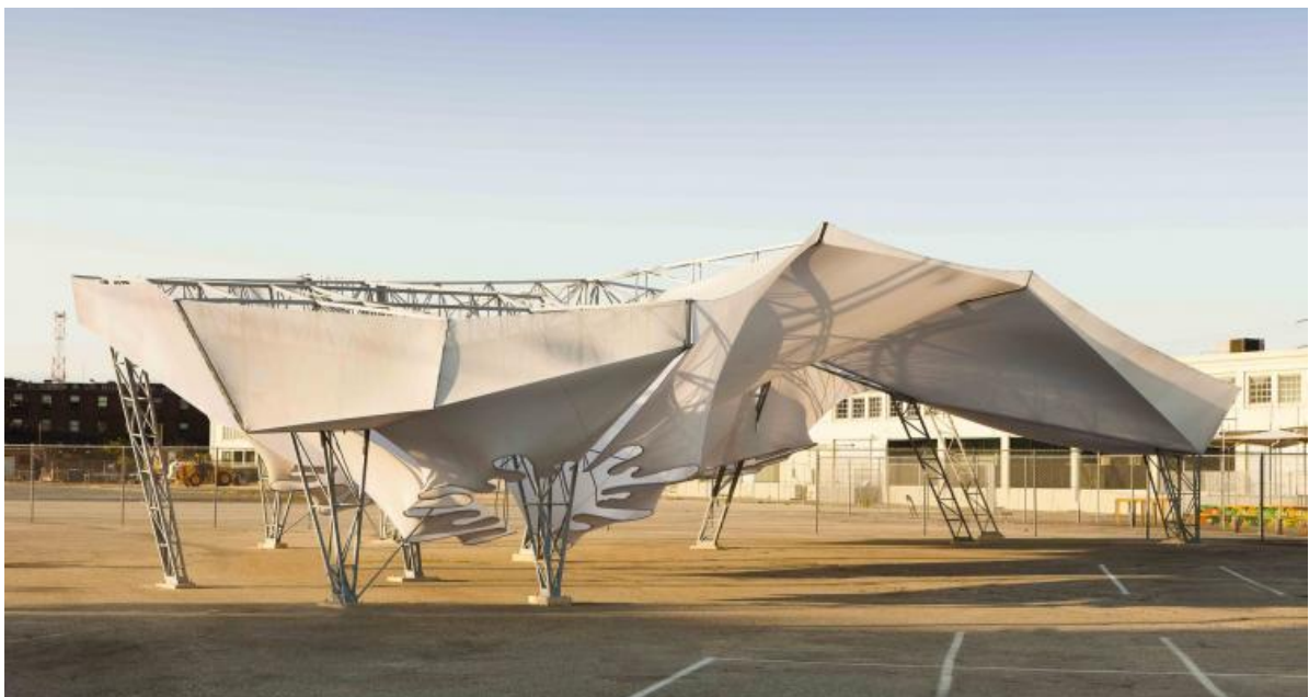
نصب سازه StormCloud، طراحی و ساخت توسط اوایلر وو (Oyler Wu) و همکاران به همراه دانشجویان موسسه معماری کالیفرنیا جنوبی

آموزش معماری در این دانشگاه بسیار عمل‌گرا و تجربه محور است. علاوه بر آن در میان اساتید آن، معماران برجسته‌ای از جمله برندگان جایزه پریتزکر وجود دارند.