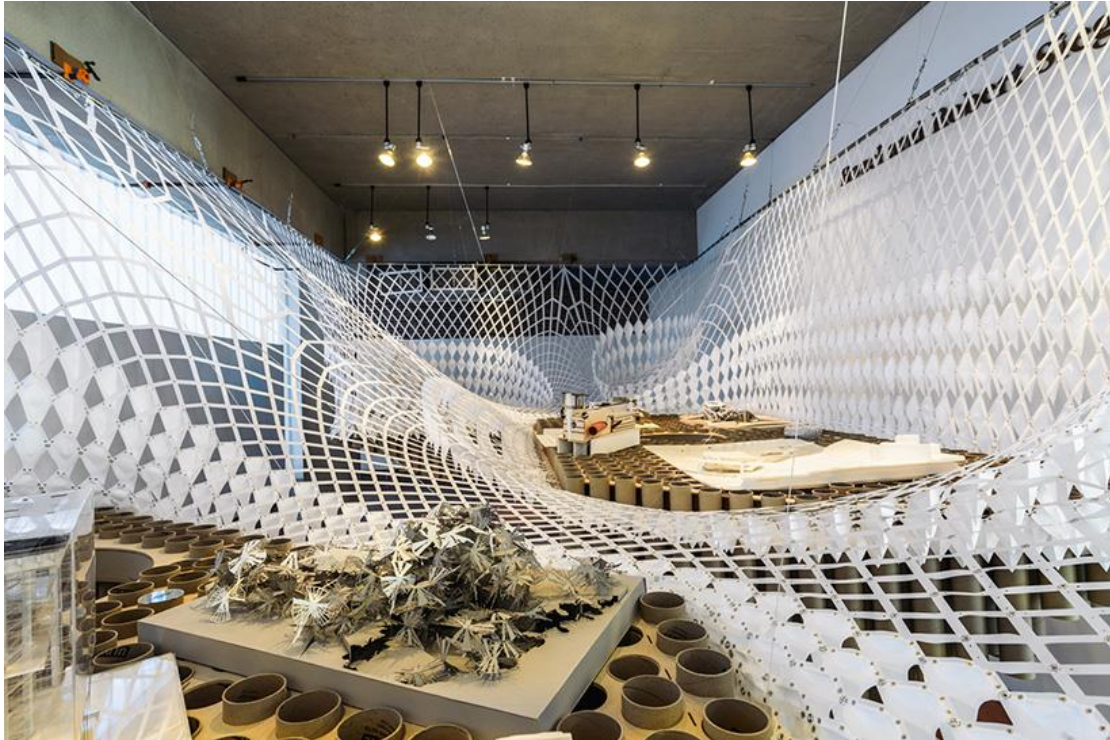
گالری سیگل (Siegel) در بروکلین نیویورک در سال ۲۰۱۴ میلادی موسسه معماری پرات بود و نماینده دانشگاه دانش‌آموختگان طراحی شهری در آن برگزار شد.

این دانشگاه از برترین مراکز آموزش طراحی در جهان است و در زمینه هنر مشهور است. در برنامه آکادمیک این دانشگاه تأکید بر آن است که معماری به عنوان یک هنر شناخته شود.