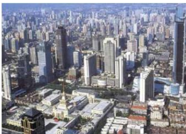
شکل ۶. Shanghai Center، امروز، در برابر ساخت و سازهای اخیر برج کوچکی است.