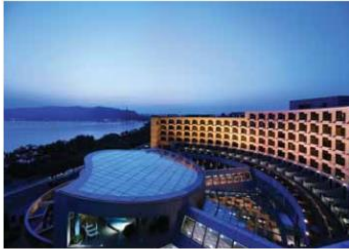
شکل ۸. طراحی Hyatt Regency Hangzhou به گونه‌ای انجام شده است که کاملاً از مزیت زیبایی دریاچه غرب چین بهره‌برد

با قرارگیری در یک محل غالب، Beijing Yintai Center چه از نظر سطح خیابان و چه از نظر آسمان منحصر به فرد است. توسعه سریع و ساخت و سازهای جدید چینش جدیدی را در آسمان پکن ایجاد کرده است که در آن شکل‌های سقف‌ها با دقت شکل داده شده‌اند و دسته‌بندی مصالح ساختمان و رنگ‌های آن‌ها با هم در جلب توجه رقابت می‌کنند. راه‌حل طراحی، تقارن پلان، ظرافت طراحی و سادگی شکل را برای متمایز کردن Beijing Yintai Center از پروژه‌های مجاور به کار گرفته است.