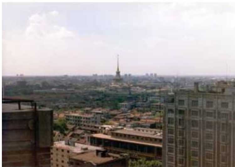
شکل ۲. عکس شانگهای بعد از باز شدن مرزهای چین اوایل دهه ۱۹۸۰.

رهبر Deng به شدت تحت تأثیر آتلانتا قرار گرفته بود و این احساس دوطرفه بود. او ضیافت ناهاری را گرفت و در آنجا در مورد رشد و آینده چین صحبت کرده و همه را تحت تأثیر قرار داد (شکل ۴ را ببینید). بعد از این ضیافت گروه دعوت شده که پدرم هم جزو آن‌ها بود را برای دیدن چین دعوت کرد. آشنایی با Deng در آن سفر به ما امکان ایجاد زمینه ای برای فرصت‌های آینده در چین را داد.