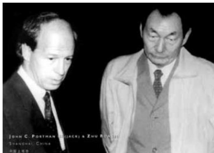
شکل ۱. جک پورتمن و ژو رانجی – شهردار بعدی شانگهای – Circa سال ۱۹۹۰.

در ژانویه ۱۹۷۹، تنها یک هفته بعد از عادی شدن روابط بین چین و ایالات متحده، من این امتیاز را داشتم که به شانگهای، پکن و هانگ‌ژو سفر کنم تا فرصت‌های شغلی احتمالی را بررسی کنم. تجربه کردن شانگهای در سال ۱۹۷۹ (شکل ۲ را ببینید) مانند سفر به گذشته بود. راه‌های باریک که درختان آن را احاطه کرده بودند و تقریباً بدون هیچ ماشینی و فقط تعداد زیادی دوچرخه. در مقایسه با شهرهای پر از اتومبیل آمریکا تقریباً شهر ساکتی بود. روشنایی کهربایی ملایم به خیابان‌ها جلوه‌ای جادویی بخشیده بود. تجربه‌ای شبیه به زندگی در دهه ۱۹۴۰ بود. انگار هیچ چیز در این سال‌ها تغییر نکرده بود. مردم همه لباس‌های آبی و خاکستری پوشیده بودند، هیچ رنگ دیگری نبود، انگار در یک فیلم سیاه و سفید زندگی می‌کردند. به عنوان کسی که شاهد زندگی در شانگهای در ابتدای مدرنیته شدن و باز شدن ایده‌های جدید از دنیای بیرون بوده است، می‌دانم که این شهر چه راه طولانی را برای رسیدن به چیزی که امروز هست، در مدتی نسبتاً کوتاه پیموده است.