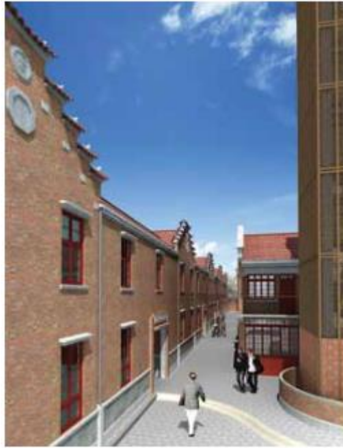
شکل ۱۱. Horse ead Wall سنتی در Portman House | Jian Ye Li