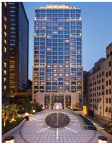
شکل ۱۰. حیاط جدید و ساختمان مهمانان Waldorf Astoria Shanghai در Bund