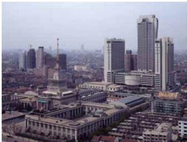
شکل ۵. Shanghai Center در سال ۱۹۹۱ آسمان‌شانه‌های را در تصرف خود در آورده است.