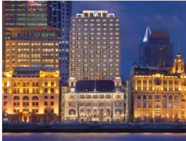
شکل ۹. Waldorf Astoria Shanghai در Bund از طرف درگیر رودخانه Huang Pu