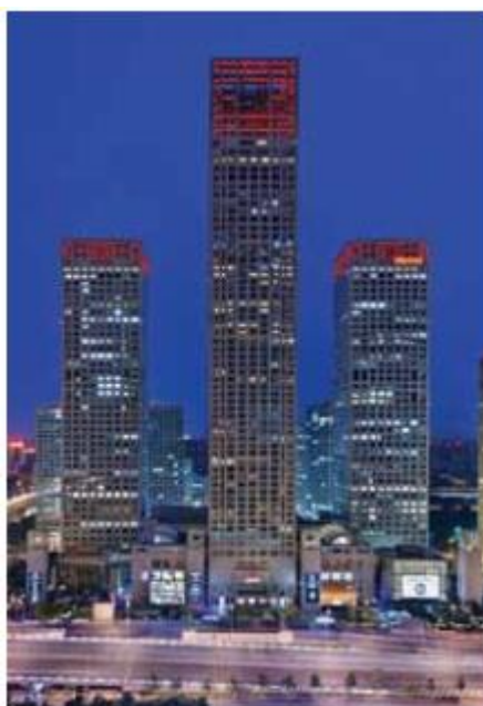
شکل ۷. بالای برج‌های Beijing Yuntai Center از فانوس‌های دریایی سنتی چین‌ها الهام گرفته شده است.