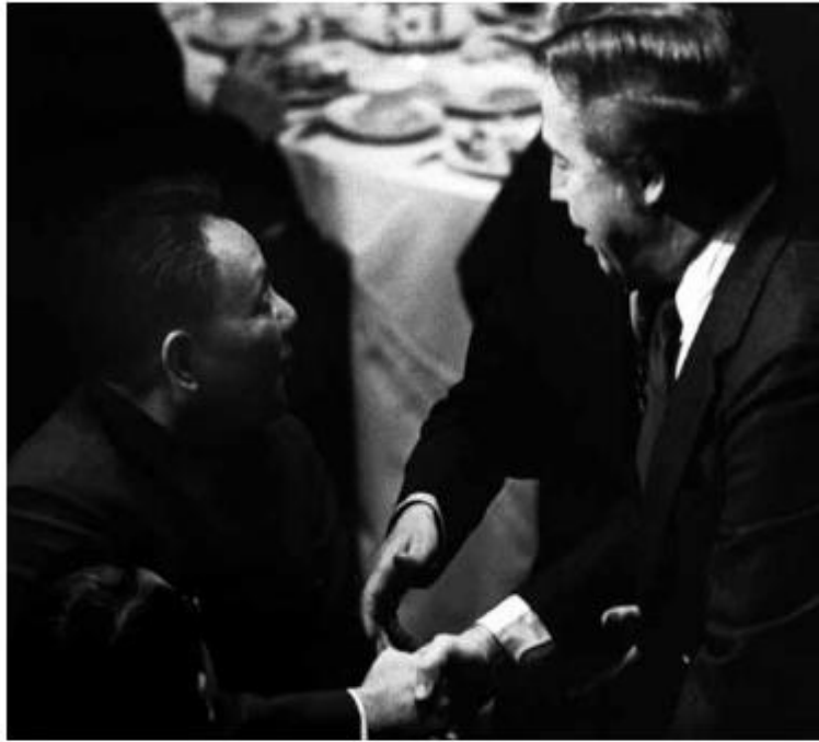
شکل ۴. Deng Xiao Ping در حال ملاقات با جان پوتن در Westin Peachtree Plaza در سال ۱۹۷۹.